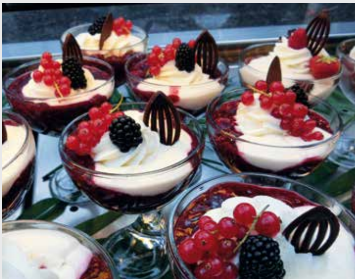
Rotze Grütze Nachspeise