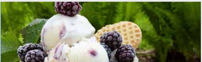
Vanilleeis mit Früchten